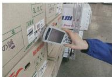
入荷時にバーコード管理