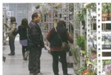
花屋さん(買受人・買出人)

仲卸業者と同様に卸売業者から直接セリ・相対取引によって品物を買う業者のこと。買受人となるには、開設者の承認が必要です。