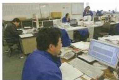
予約相對販売、注文販売