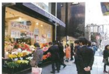
産地フェア(花屋さん)