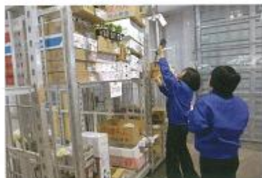
買受人ごとの台車へ