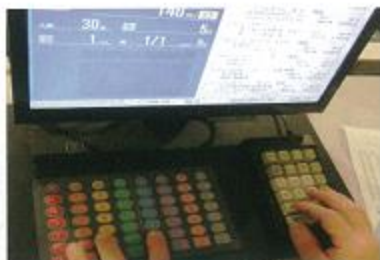
買受人用セリ端末