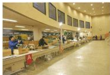
卸売場でのセリの様子

出荷者(生産者・出荷団体)から品物を集荷し、市場内の卸売場で、セリ・相対取引などを行って仲卸業者や花屋さん・量販店などの買受人に販売します。 卸売業者として営業するためには、愛知県知事の許可が必要です。