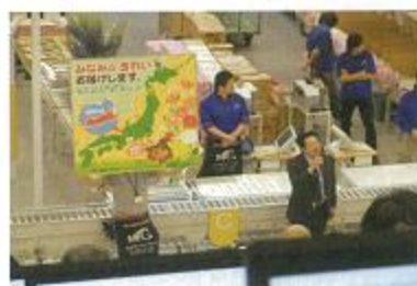
産地フェア(市場内)