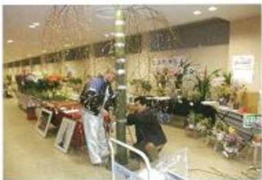
市場内展示受注会