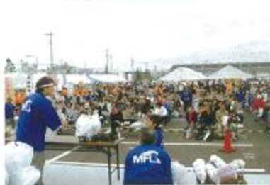
食肉・花き市場まつり

※詳しくは 株式会社名港フラワーブリッジ http://www.meikoflowerbridge.co.jp/ にてご確認下さい。