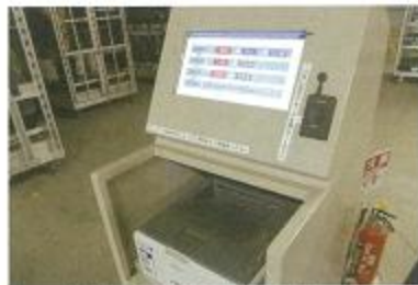
お買上げ伝票を出します。