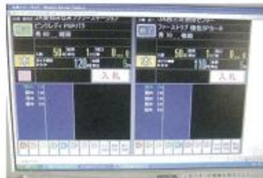
ライブオークション画面