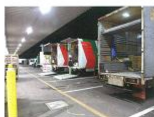
(株)名港フラワーライン

手作りおにぎり・トーストなどの軽食とコーヒー・紅茶・ジュースなどのドリンクを販売しています。