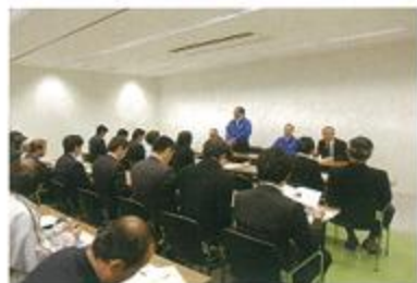
市場見学者への説明会

愛知名港花き地方卸売市場の開設者(愛知県知事許可)として、市場を管理運営し、日常の取引や価格決定が円滑に行われるように努めています。また、取引委員会、運営協議会を置き、市場運営の円滑化を図っています。