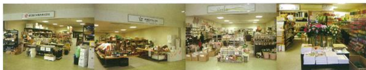
福花園花き販売(株)港店