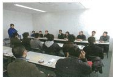
オリジナル商品開発・検討会