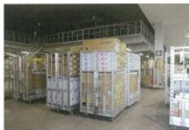
全館空調で定温管理